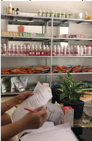
Ảnh 2: Người bán thuốc tại đại lý thuốc tỉnh Bắc Giang, năm 2020