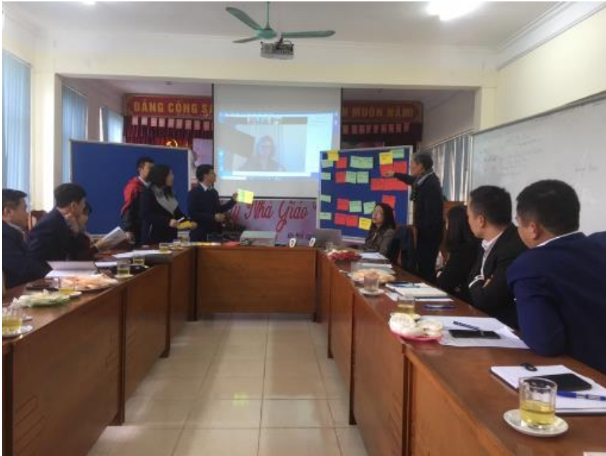
Ảnh 1 - Xây dựng chuỗi giá trị sản phẩm thuốc thú y và mối quan hệ giữa các bên liên quan. Hội thảo luận nhóm với các đại diện từ cơ quan nhà nước, đại diện các công ty thức ăn chăn nuôi, nhà sản xuất và phân phối sản phẩm thuốc thú y, người bán thuốc tại Hà Nội, 2020